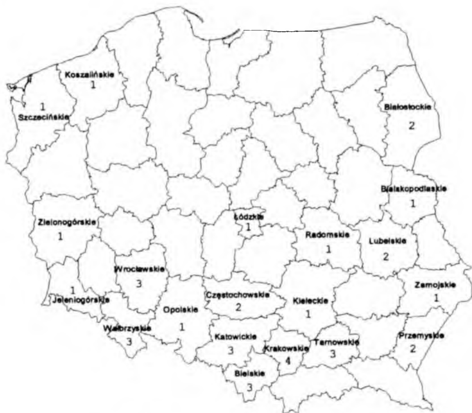
Ryc. 1. Zachorowania na tężec w 1997 roku wg województw